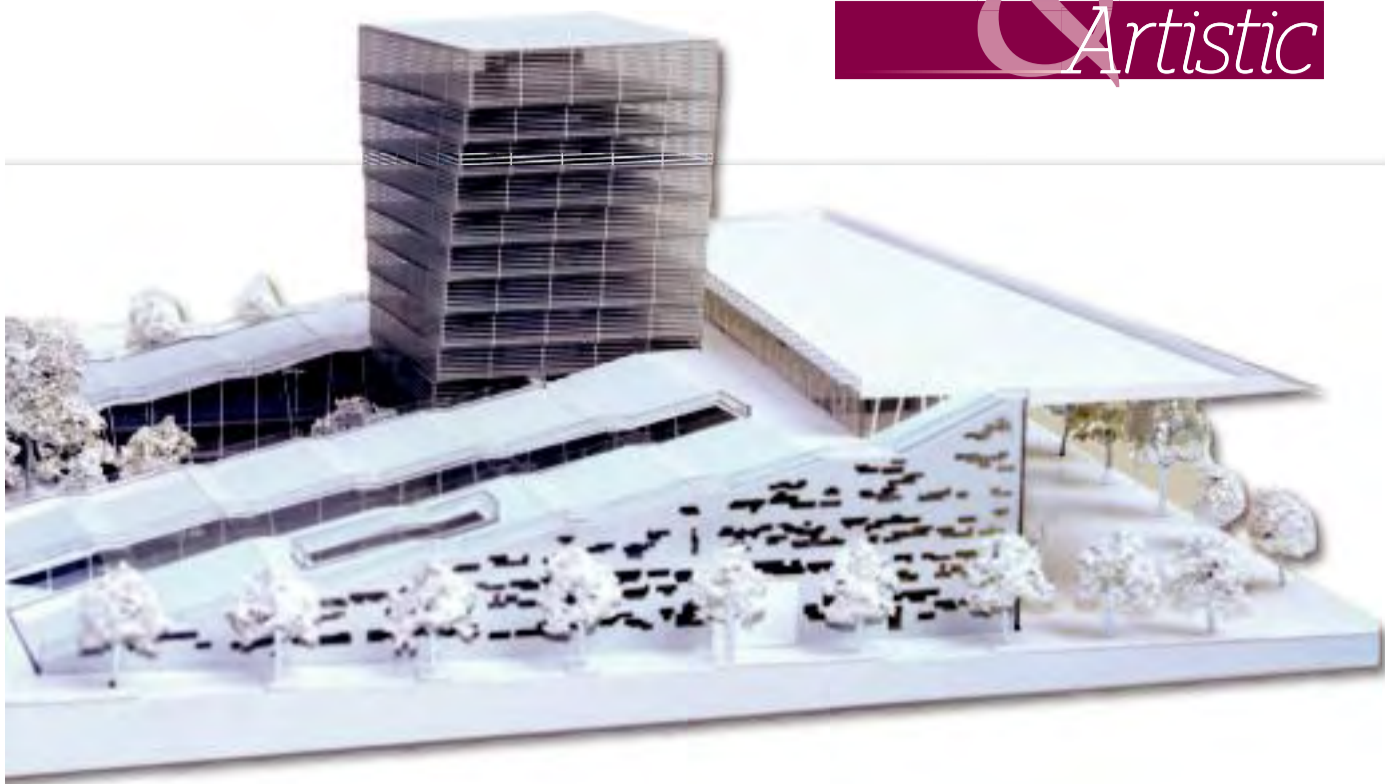
Concurs de arhitectură - Proiect al bibliotecii din Praga (Arh. Radu Drăgan)

nesc, curs susținut la Sorbona la catedra unde ai făcut ultimul doctorat.