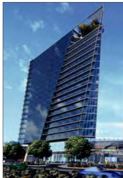
Proiect de hotel în București (Arh. Radu Drăgan)

La un moment dat aveam trei curriculum vitae: unul de arhitect, unul de antropolog și unul de cercetător în domeniul istoriei religiilor